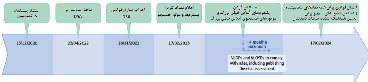
شکل ۱- برنامه زمانی قانون بازارهای دیجیتال و قانون خدمات دیجیتال